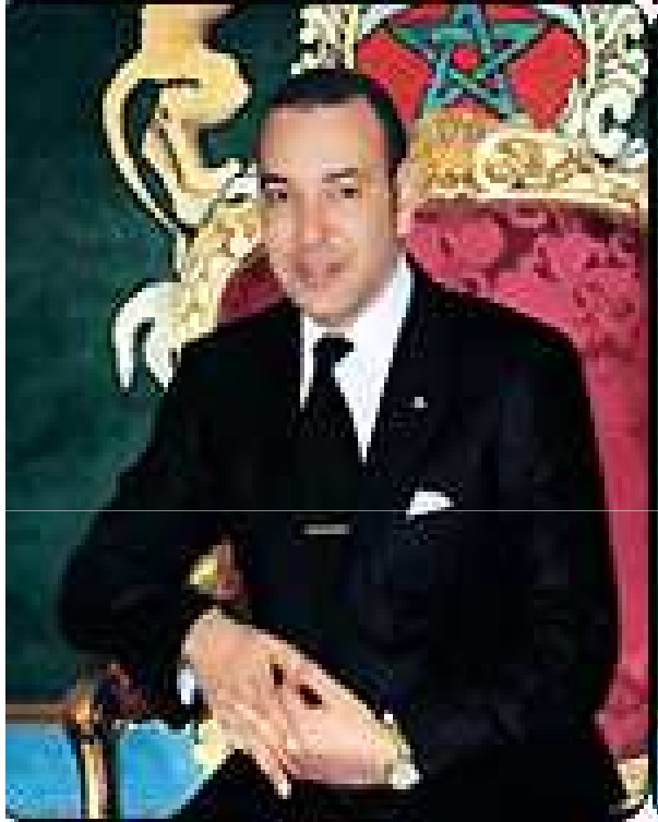
Sa Majesté le Roi Mohammed VI